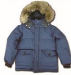
第1次南極地域観測隊 羽毛服(レプリカ)

東洋羽毛は、マナスル登山隊、当時の防衛庁他に羽毛服やシュラフを納入していた実績が認められ、戦後の日本の復興をかけた国家プロジェクト「南極観測」の越冬隊用羽毛服の依頼が舞い込みました。その後、ダウンジャケット部門は分離独立して「株式会社ザンター」となりますが、今でも南極地域観測隊(越冬隊)で使用されている一部の羽毛服には、東洋羽毛の羽毛が使用されています。