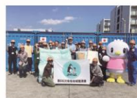
2024年第66次南極地域観測隊の皆様と

南極地域観測隊の眠りをサポートするため、2022年から南極地域観測隊(越冬隊)に羽毛ふとん他寝具一式を寄贈しています。また、南極地域観測隊で使用された役目を終えた羽毛ふとんを引取り、中の羽毛を丁寧に洗浄して、南極地域観測隊への新たな寄贈品の一部に再利用 ※ しています。私たちは、持続可能な未来に向けて循環型の寄贈を行っています。 ※ 2024年～