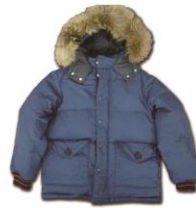
第1次南極地域観測隊 羽毛服(レプリカ)

東洋羽毛は、マナスル登山隊、当時の防衛庁他に羽毛服やシュラフを納入していた実績が認められ、戦後の日本の復興をかけた国家プロジェクト「南極観測」の越冬隊用羽毛服の依頼が舞い込みました。その後、ダウンジャケット部門は分離独立して「株式会社ザンター」となりますが、今でも南極地域観測隊(越冬隊)で使用されている一部の羽毛服には、東洋羽毛の羽毛が使用されています。