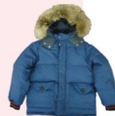
第一次南極観測隊 羽毛服レプリカ

東洋羽毛は1951年頃から日本山岳会マナスル登山隊と共同研究を行い、マナスル登山隊、エベレスト登山隊、当時の防衛庁に羽毛服やシュラフを納入していました。その実績が認められ、戦後の日本の復活をかけた国家プロジェクト「南極観測」の越冬隊用羽毛服の依頼が舞い込んだのです。その後、ダウンジャケット部門は分離独立して「株式会社ザンター」となりますが、今でも南極観測隊に納入しているダウンジャケットには、東洋羽毛の「羽毛」が使用されています。