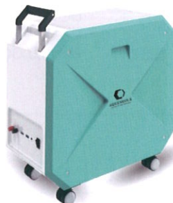
アクエネオス キャリー300