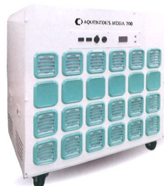
アクエネオス メガ700